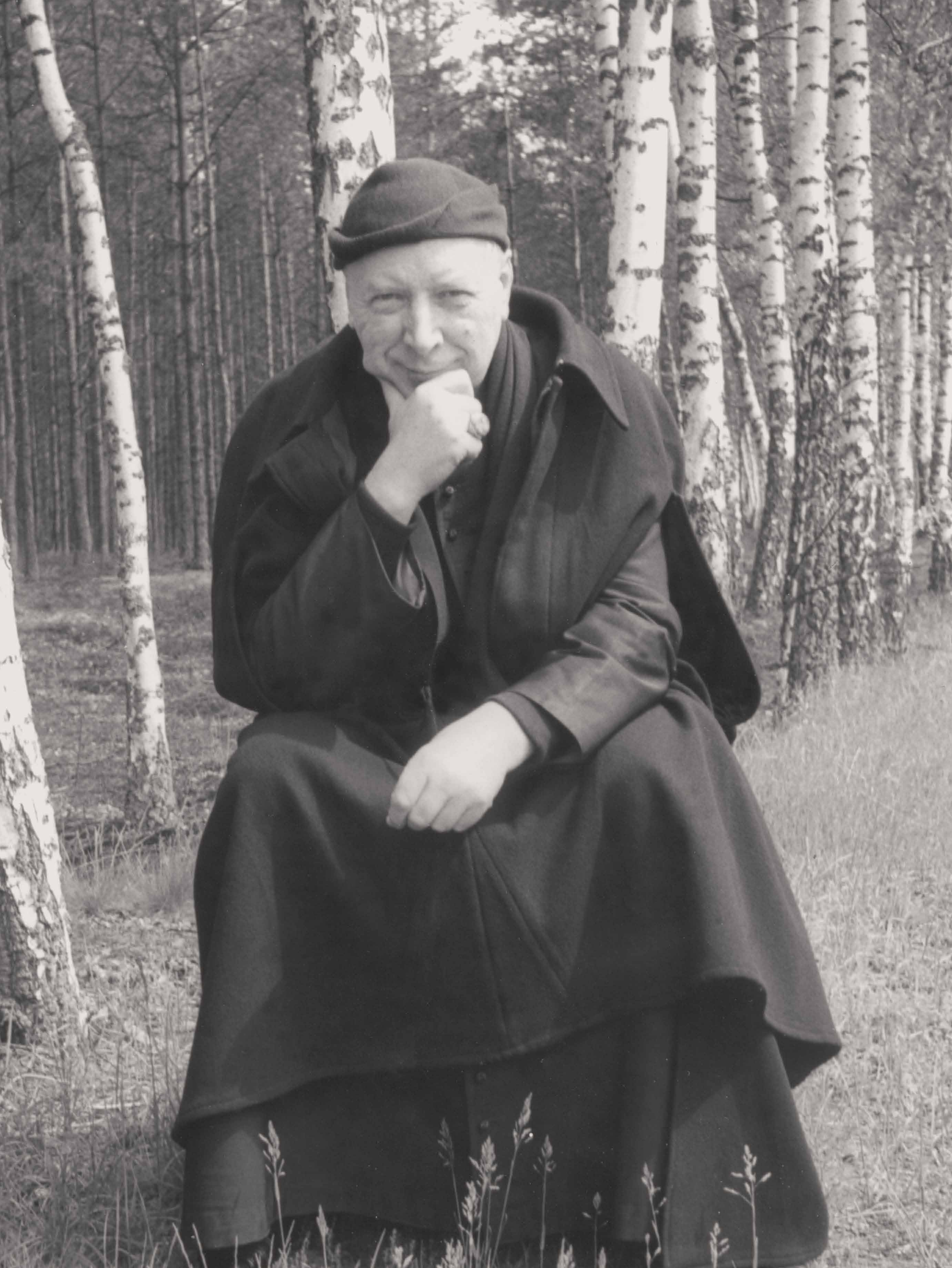
Prymas Stefan Wyszyński w drodze powrotnej z uroczystości milenijnych w Sosnowcu, 1967 r.

[Instytut Prymasowski Stefana Kardynała Wyszyńskiego]