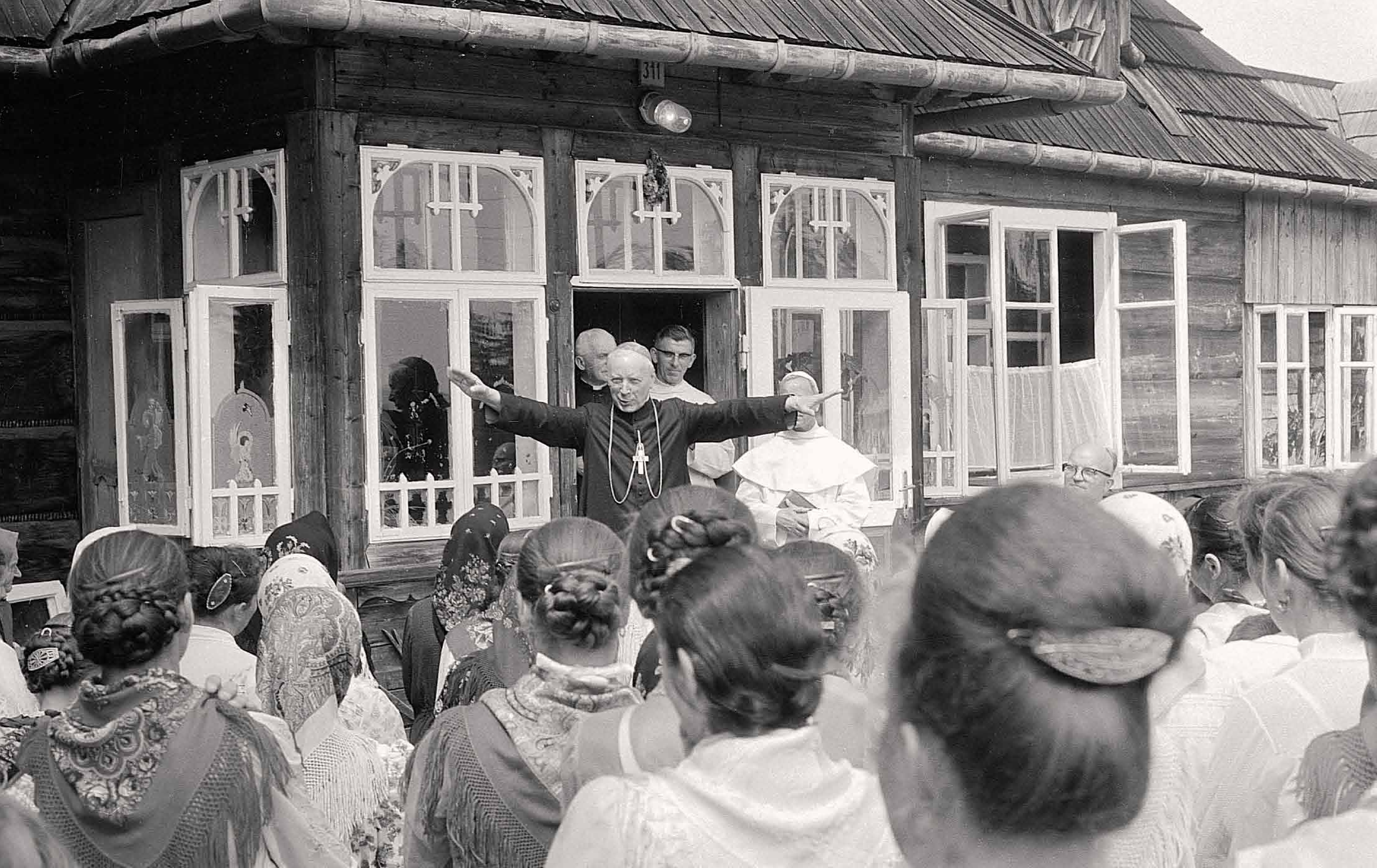
Prymas Stefan Wyszyński podczas wakacji na spotkaniu z góralkami, Bachledówka, 1967 r.