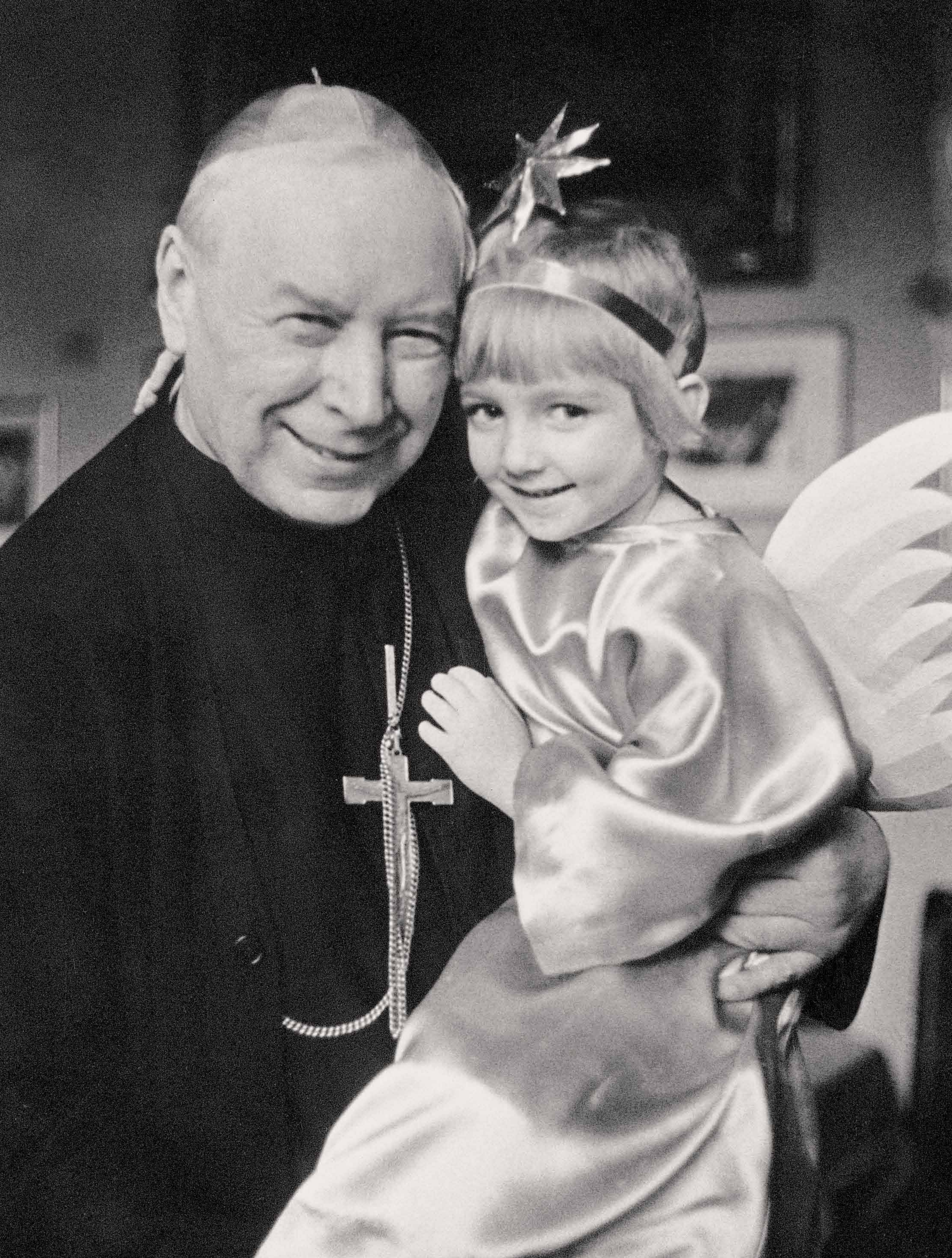
Rezydencja Arcybiskupów Warszawskich przy ul. Miodowej w Warszawie, 20 stycznia 1974 r.