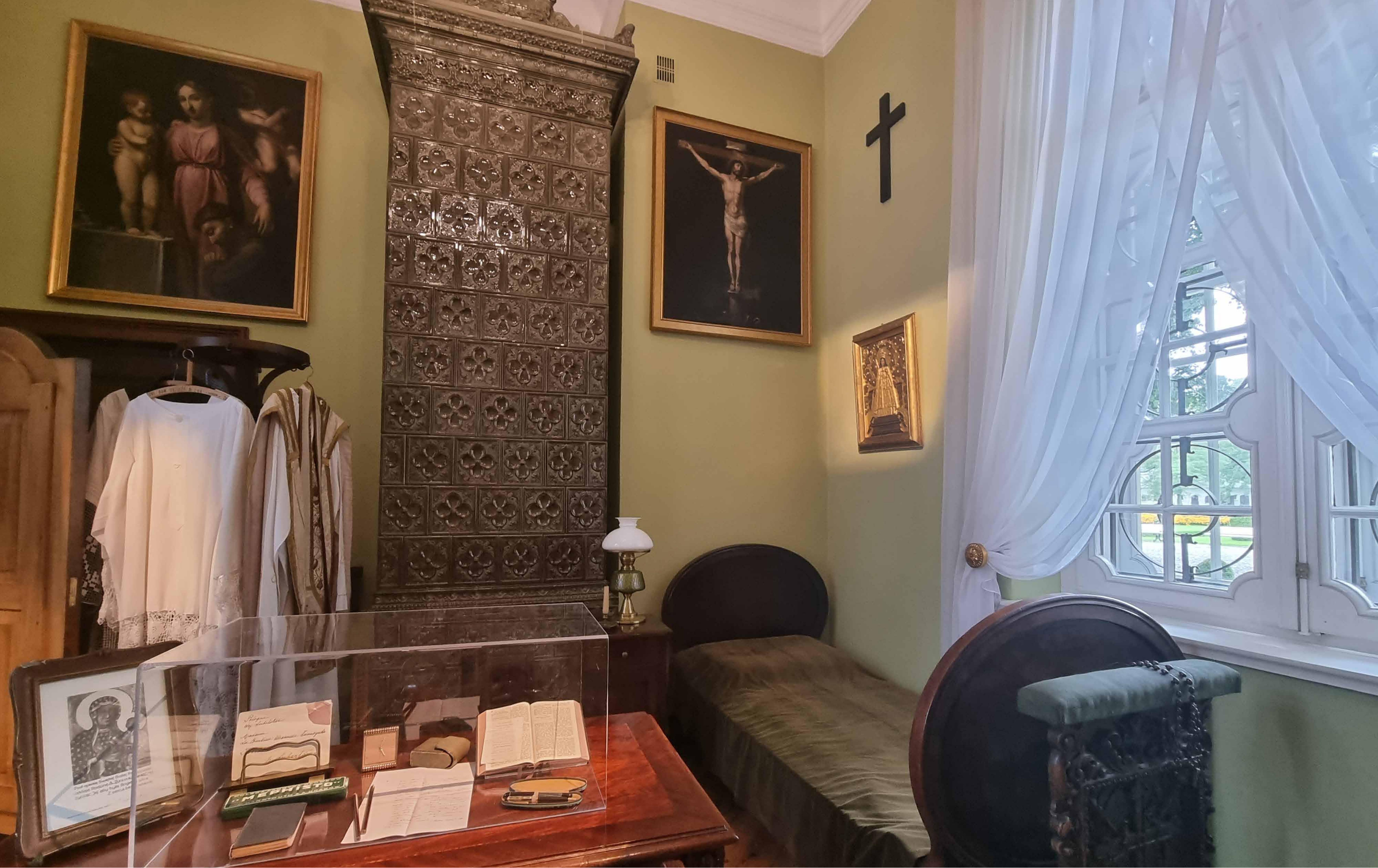
Rekonstrukcja pokoju księdza Stefana Wyszyńskiego w Kozłowce, gdzie pełnił posługę duszpasterską w latach 1940–1941.