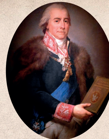
Tomasz Adam Ostrowski – Prezes Senatu Księstwa Warszawskiego i Królestwa Polskiego w latach 1811–1817 (portret pędzla M. Baciarellego)