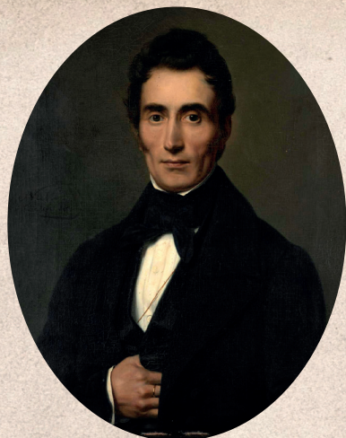
Adam Jerzy Czartoryski – książę, ostatni Prezes Senatu Królestwa Polskiego przed wybuchem powstania listopadowego, założyciel obozu Hotel Lambert (portret pędzla J.P. Norblina)