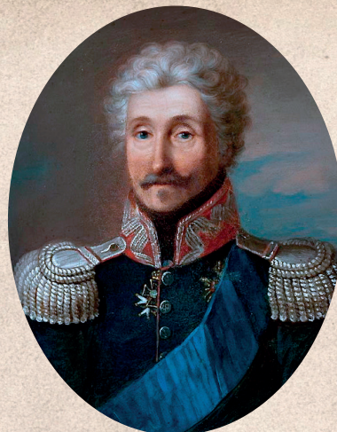
Józef Zajączek – senator Królestwa Polskiego i jego namiestnik w latach 1815–1826 (portret pędzla nieznanego artysty)