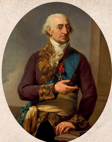
Stanisław Małachowski – hrabia, marszałek Sejmu Wielkiego, pierwszy Prezes Senatu Księstwa Warszawskiego w latach 1807–1809 (portret pędzla M. Baciarellego)