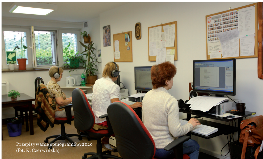
Przepisywanie stenogramów, 2020

OBECNIE SEJM I SENAT MAJĄ ODDZIELNE DZIAŁY PRZYGOTOWUJĄCE SPRAWOZDANIA Z OBRAD IZB. W Senacie Dział Stenogramów stanowi część Biura Prac Senackich, w Sejmie Wydział Sprawozdań Stenograficznych należy do Sekretariatu Posiedzeń Sejmu. Obrady Senatu są nagrywane w formie cyfrowych plików audio i wideo. Plik audio na bieżąco dzieli się na 5-minutowe fragmenty, z których jest spisywany tekst stenogramu. Wątpliwości co do fragmentu nagrania rozstrzyga stenograf w porozumieniu z mówcą. Nad spisany tekstami wypowiedzi równoległe pracują redaktorzy, przekształcając żywe słowo z sali obrad w język pisany, m.in. poprzez wprowadzanie znaków przestankowych, usuwanie powtórzeń czy błędów językowych.