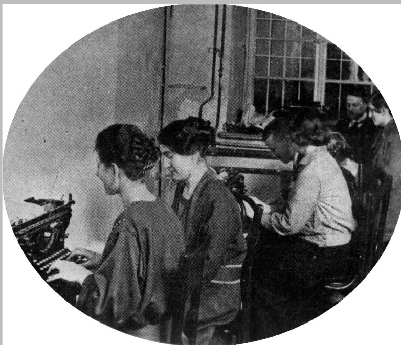
Przepisywanie stenogramów, 1923 (Tygodnik Ilustrowany)

W OKRESIE XX-LECIA MIĘDZYWOJENNEGO NA RZECZ SEJMU I SENATU PRACOWAŁY BIURO STENOGRAFICZNE SEJMU I SENATU RP ORAZ REDAKCJA SPRAWOZDAŃ STENOGRAFICZNYCH I DJARIUSZA. Biuro Stenograficzne zostało zorganizowane w maju 1918 r. dla potrzeb Tymczasowej Rady Stanu i przeniesione po jej rozwiązaniu do Sejmu Ustawodawczego. W 1928 r. pracowało w nim 13 stenografów. W redakcji sprawozdań, 14 lat kierowanej przez znanego pisarza Karola Irzykowskiego, oprócz niego pracowało 2 redaktorów. Zadaniem ich było redakcyjne opracowywanie urzędowego „Sprawozdania Stenograficznego”. Przygotowywali oni także, kolejno zmieniając się na sali obrad, „Djariusz”, czyli skróconą relację z obrad, przeznaczoną do natychmiastowego przekazania prasie i agencjom telegraficznym. Dziennikarze otrzymywali ją co pół godziny w formie biuletynu zawierającego streszczenia przemówień, teksty wniosków i uchwał, wyniki głosowań oraz opis tego, co działo się na sali.