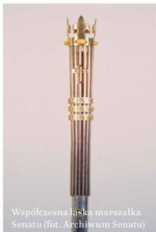
Współczesna laska marszałka Senatu